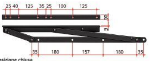
Posizione chiusa Closed position