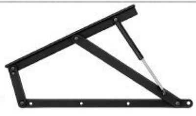
Posizione aperta Open position